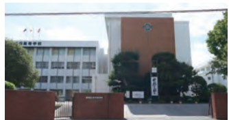
福岡県立春日高等学校 徒歩約11分(約880m)