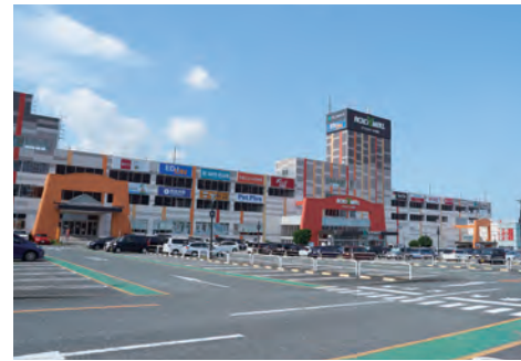
アクロスモール春日 徒歩約11分(約870m)