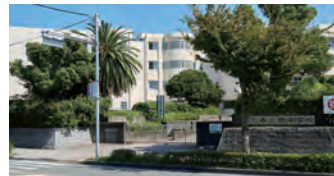
春日市立春日野中学校 徒歩約4分(約260m)