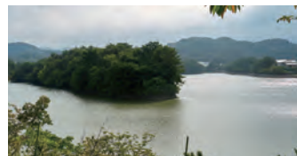
白水大池公園 車約7分(約2,400m) (白水大池公園星の館)