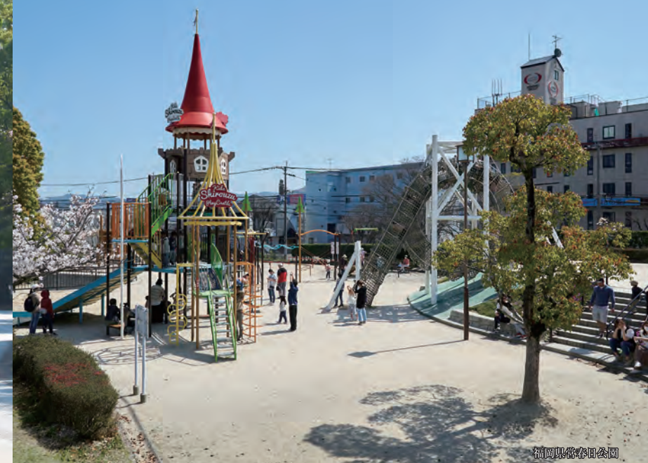
福岡県営春日公園