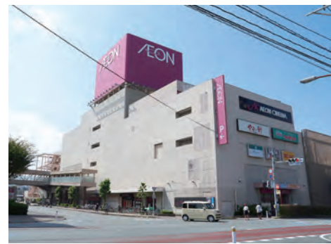
イオン大野城ショッピングセンター 車約5分(約1,900m)