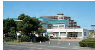
春日市立春日野小学校 徒歩約3分(約220m)