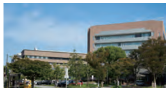
春日市総合スポーツセンター 車約6分(約2,300m)