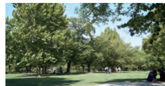
福岡県営春日公園 徒歩約2分(約110m)