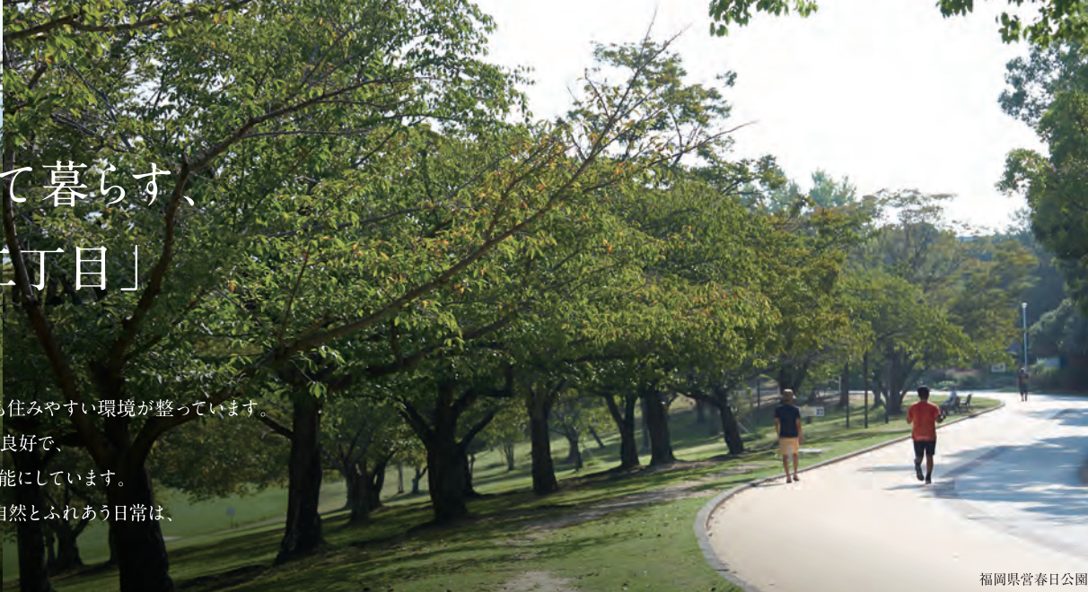
福岡県営春日公園

春日二丁目エリアは、福岡県春日市の中心部に位置し、 利便性が高く、落ち着いた住宅街が広がるエリアです。 小学校や中学校も徒歩圏内にあるので、子育て世代にとっても住みやすい環境が整っています。 また、春日二丁目からは、福岡市内や周辺都市へのアクセスも良好で、 JR「大野城駅」や西鉄「春日原駅」を使っの、通勤・通学も可能にしています。 春日公園をはじめとした緑豊かな公園が多いこのエリアでの自然とふれあう日常は、 暮らしに穏やかな時間を生み出します。